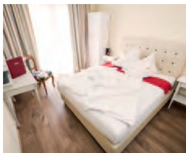
Doppelzimmer Wiesernock ca. 12m 2 , Balkon Bad/Dusche, WC Wiesernock zur Einzelnutzung ca. 12m 2 , Bad/Dusche, WC