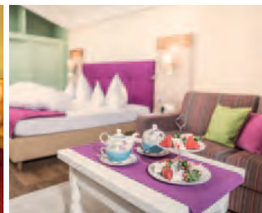
Junior Suite ca. 40m 2 , Balkon, Bad/Dusche, WC extra