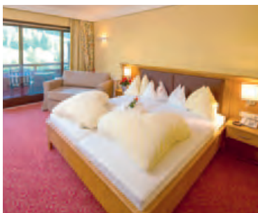
Doppelzimmer Kathrein ca. 30m 2 , Balkon, Bad/Dusche, WC extra