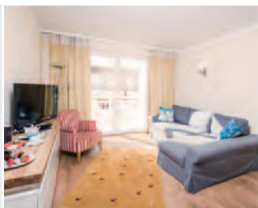
Appartement Kaiserburg ca. 45m 2 , Balkon, Bad/Dusche, WC